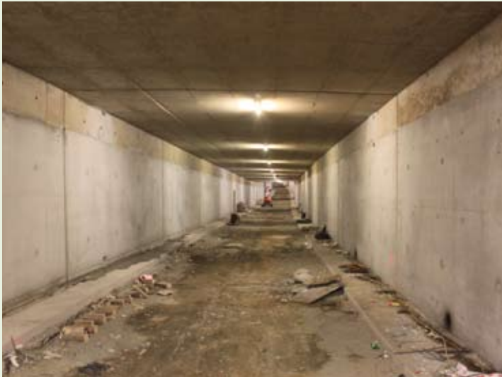
Fertige Innenschale beider Richtungsfahrbahnen vom Tunnelportal West (Ebring) bis Zufahrt Kärntnerstraße Seite im Osten.