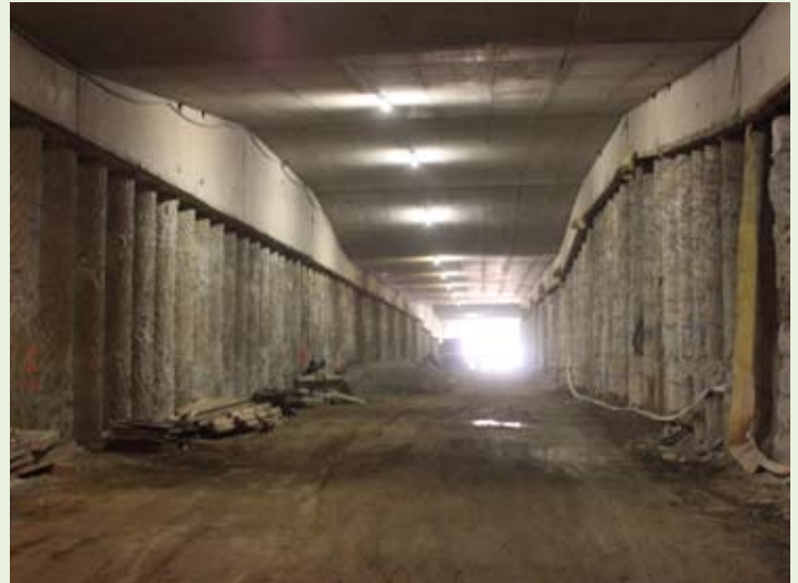
Unterflurtrasse vor der Herstellung der glatten Wände. Blick Richtung Tunnelportal Ost.