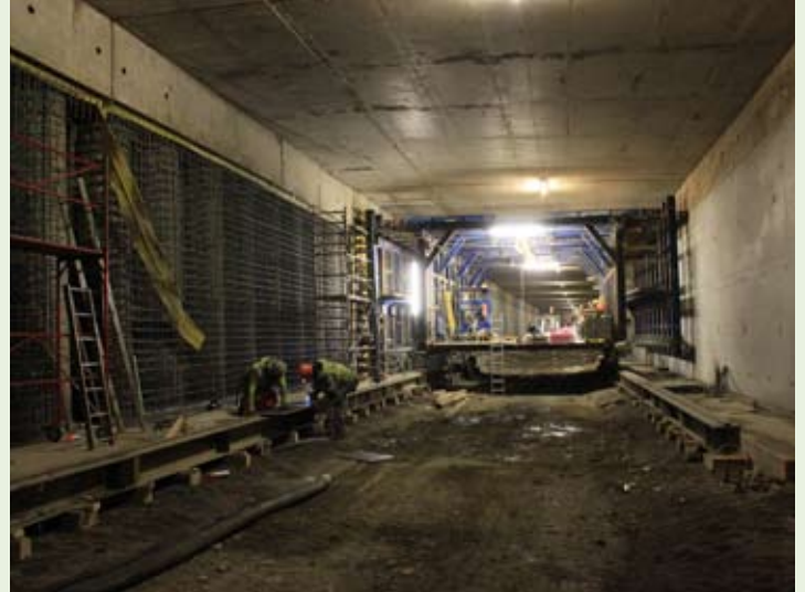
Herstellung der Außenwand mit eigens gebauten Systemschalwägen der Firma Doka.