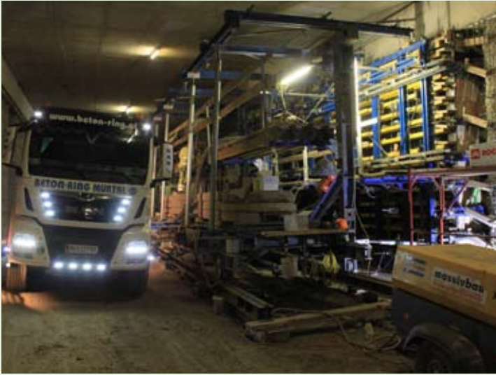
Herstellung der Mittelwand zwischen den beiden Richtungsfahrbahnen.